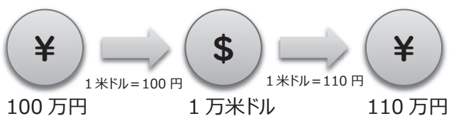
（例1）利益が発生するケース